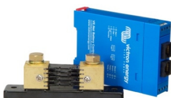
VE.Net Battery Controller

Adaptateur non nécessaire Remarque : les connecteurs RJ45 sont isolés de manière galvanique du contrôleur et du shunt.